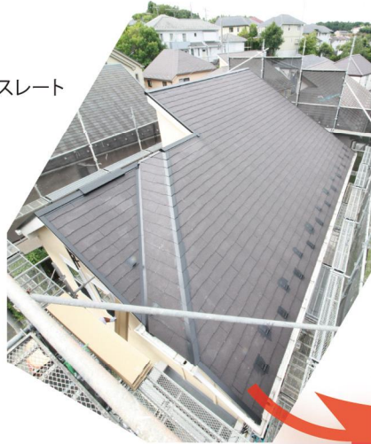
リフォーム前の平板スレート