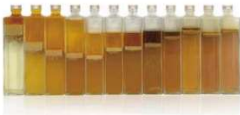
試験にて回収された再生油サンプル (回収時刻ごとに分類)