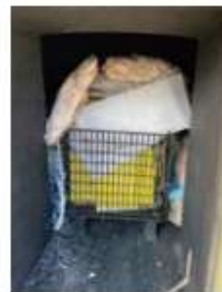
サンプル試験処理前