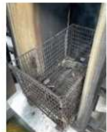
サンプル試験処理後